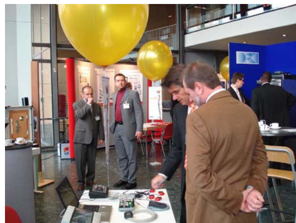
Abb. 5: Gemeinschaftsstand der Landesinitiative

Ein zentrales Anliegen der Landesinitiative besteht darin, interessante Anwendungen für Techniken der Objekt- und Mustererkennung aufzuspüren und bekannt zu machen. Vor diesem Hintergrund haben sich die Partner der Landesinitiative im 2007 an der Gestaltung der Fachtagung zum „Innovative Technologien der Gebäudesicherheit“ beteiligt. Im Rahmen der Veranstaltung wurden Präventivmaßnahmen der Gebäudesicherheit aus kriminologischer Sicht erörtert und Anwendungsmöglichkeiten der Fingerabdruckidentifikation und der Radiofrequenzidentifikation vorgestellt. Die Zielgruppe der Veranstaltung bildeten Metallbauer, Rollladen- und Jalousienbauer und Informationstechniker. 35 Handwerker sind der Einladung gefolgt und haben an der Fachtagung teilgenommen.