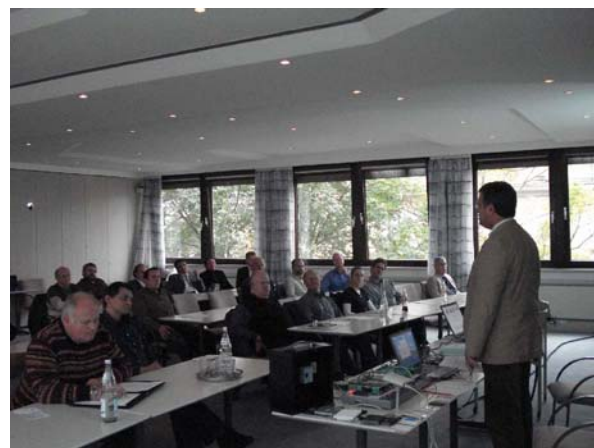
Abb. 4: Fachtagung „Gebäudesicherheit“

Eine weitere interessante Anwendung der Objekt- und Mustererkennung ist beispielsweise das Erkennen von Obst und Gemüse an der Selbstbedienungswaage eines Warenhauses. Durch den automatischen Erkennungsprozess wird dem Kunden das aufwendige Suchen des Artikels im Auswahlmenü der Waage abgenommen. Sofern es dem Erkennungssystem nicht gelingt, die Ware eindeutig zu bestimmen, so gelingt es in der Regel doch, die Treffermenge einzuschränken und somit den Suchaufwand zur Bestimmung des Artikels deutlich zu verkleinern. Zu prüfen bleibt, ob eine solche Anwendung auch auf Einsatzbereiche des Handwerks übertragen werden kann.