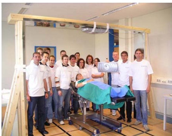
Abb. 3: Patientenüberwachung mittels RFID-Transponder