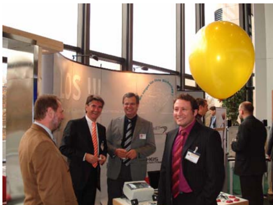
Abb. 6: Begleitausstellung des saarländischen Innovationskongresses

Anlässlich des saarländischen Innovationskongresses „Empower Deutschland – Mit Innovation zu neuer Stärke“ beteiligte sich die Landesinitiative für Objekterkennung und Sicherheitstechnik mit einem Gemeinschaftsstand an der Begleitausstellung „Empower Science – Geniales Saarlandes“. Präsentiert wurden das Funktionsprinzip des elektronischen Fingerabdruckerkennungssystems des Unternehmen Jerra Soft, das kompakte Alarm- und Sicherheitssystem mit Feuer-, Gas-, Wasser- und Einbruchmelder des Unternehmens Alarmtechnik Norbert Theis und das Radiofrequenzidentifikationssystem zum Lokalisieren und Erkennen von Patienten im Operationsbereich eines Krakenhauses des Forschungsteams von Prof. Dr. Martin Buchholz von der Hochschule für Technik und Wirtschaft des Saarlandes.