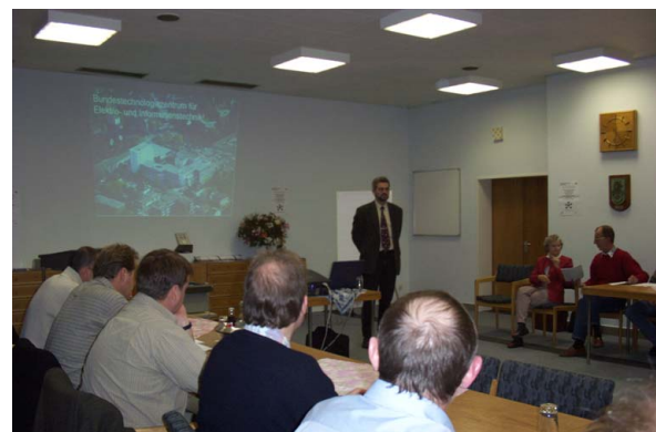
Abb. 1: Teilnehmer eines Qualifizierungsmoduls

Bei der Durchführung dieses modularen Konzeptes und anschließender Zertifizierungsmaßnahmen beider Teilbereiche bis 2005 beteiligten sich zwölf Unternehmen der Region mit insgesamt zwanzig Fachkräften.