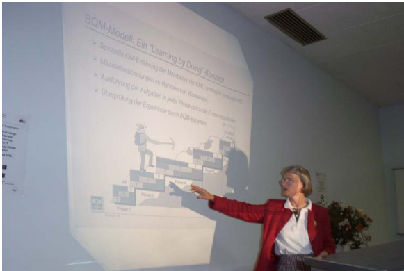
Abb. 2: Ein Vortrag während eines Qualifizierungsmoduls

Des Weiteren beteiligten sich drei Betriebe (zwei Firmen aus der Elektro- und eine aus der Metall-Branche) mit insgesamt acht Fachkräften an einem seitens der RKW-Bremen geförderten Zertifizierungswegedgangs zur Erreichung einer betrieblichen QM-Gesamtzertifizierung.