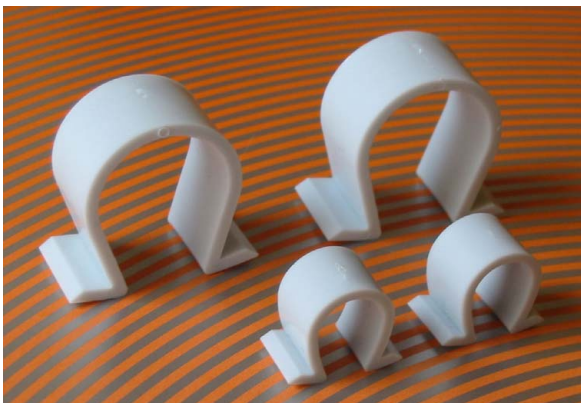
Abb. 1: Die oMEGA-Mauernutschelle Typ A und B