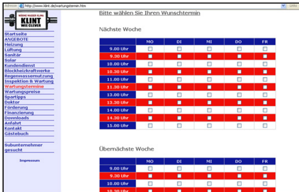
Wunschliste für Wartungstermine

Zur Erreichung der Ziele sollte eine der genannten Marketingmaßnahmen beitragen. Die Studierenden entschieden sich für eine vergleichende Betrachtung eines mobilen und eines festen Messestandes.