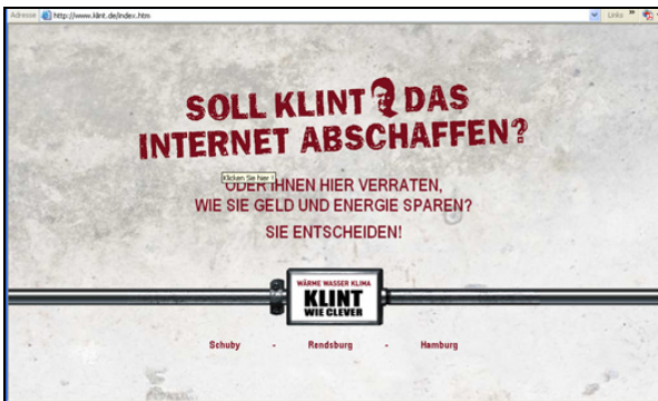
Startseite des Internetauftritts www.klint.de

Die Technologie-Transfer-Beauftragten (TT-Beauftragten) der Hochschulen, der IHK zu Flensburg und der Handwerkskammer (HwK) Flensburg organisieren zusammen mit der regionalen Wirtschaftsförderungsgesellschaft regelmäßige Veranstaltungen, in denen für kleine und mittlere Unternehmen (KMU) und Hochschulen relevante Themen beider Interessengruppen vorgestellt werden. Aus diesen Veranstaltungen sind schon vielfältige Kontakte und Projekte entstanden, so auch das Folgende: