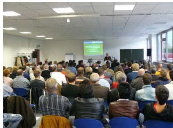
Abb. 2: Veranstaltung

2007 gegründet und wird getragen von der Universität Konstanz, der HTWG Konstanz, der Handwerkskammer Konstanz, der IHK Hochrhein-Bodensee, der Steinbeisstiftung Stuttgart, dem Bodenseerat und dem Singen Aktiv Standortmarketing. Die Zielgruppe waren technologieorientierte Betriebe, die bereits die Möglichkeiten der Nanotechnologie nutzen, Interesse an der Anwendung haben oder sich einen allgemeinen Überblick über die Nanotechnologie verschaffen möchten.