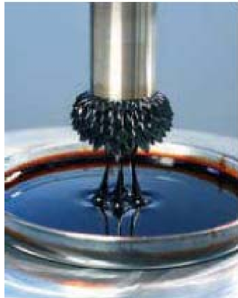
Abb. 4: Magnetit-Nanopartikel in Öl. Die Flüssigkeit lässt sich magnetisch formen

Die Resonanz auf die durchgeführten Veranstaltungen war absolut positiv. An den Veranstaltungsabenden nahmen über 100 bzw. über 70 interessierte Zuhörer teil. Darüber hinaus wurde das Nanolabor der Universität Konstanz von kleineren Gruppen besichtigt. Weiterhin gibt es die ersten Betriebe, die das Know-How und die technische Einrichtung des Nanolabors nutzen und Werkstoffe bzw. Oberflächen analysieren oder entwickeln lassen.