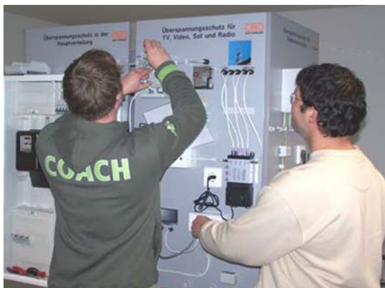
Abb. 2: Praxis-Trainingsmodul im Einsatz

Der in Zusammenarbeit mit der Firma OBO Bettermann GmbH & Co. organisierte und durchgeführte Workshop verfolgt dabei das didaktische Konzept: „Der Mensch behält 10% von dem, was er hört, 30% von dem, was er liest und 90% von dem, was er tut.“