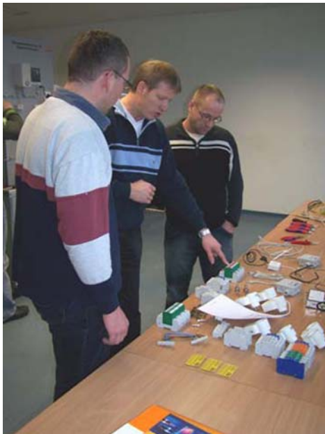
Abb. 3: Teilnehmer erarbeiten gemeinsam Problemlösungen